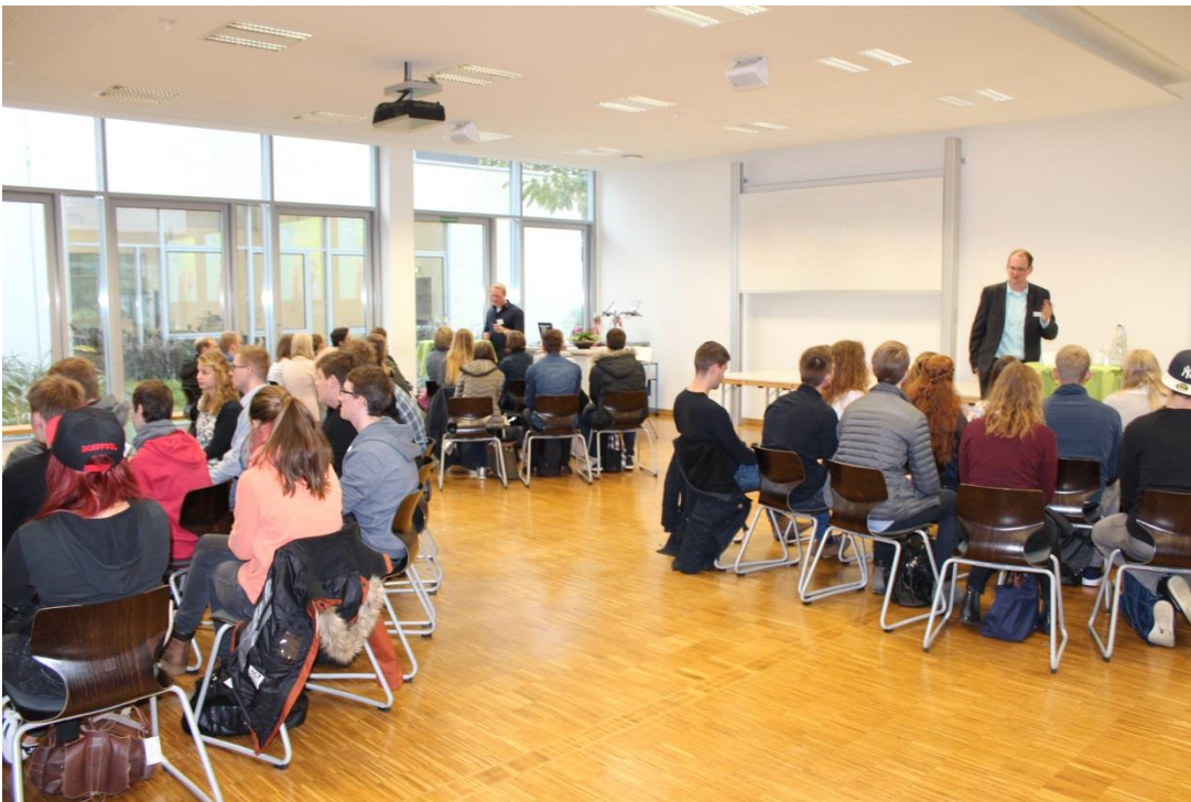
Neun Absolventen gaben den Studierenden auf Augenhöhe Tipps und Tricks für einen erfolgreichen Einstieg in das Berufsleben.