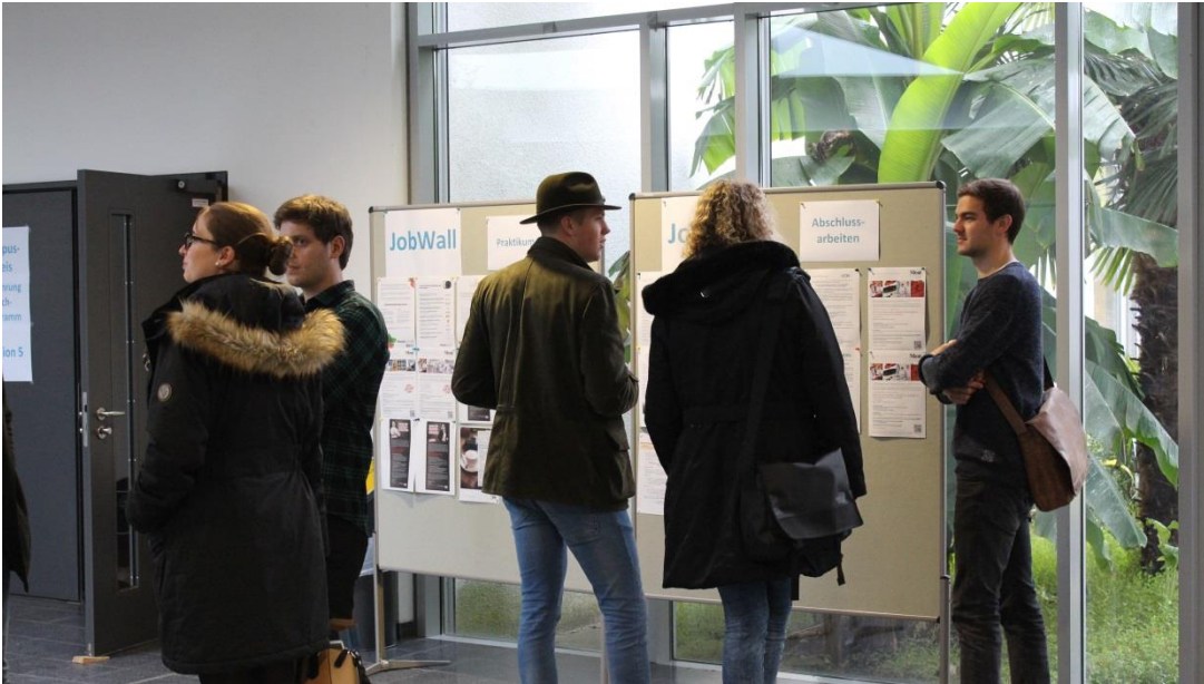
An der Job-Wall konnten sich Studierende und Absolventen über Stellenanzeigen der ausstellenden Unternehmen informieren.