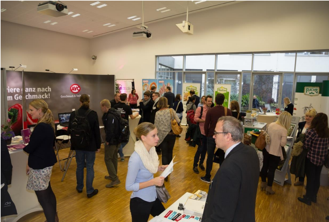
Rege Gespräche führten Unternehmensvertreter und Studierende auf dem Recruiting-Event.