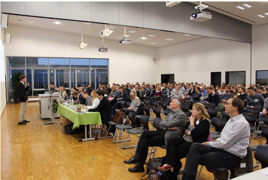
Gebannt lauschten Zuhörer und Jury den Nominierten des Campus-Preises.